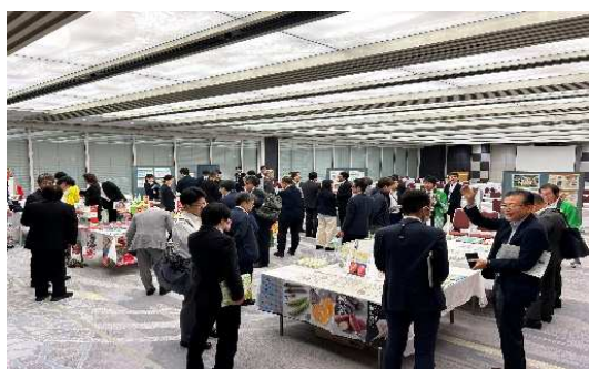
2024.10月 企業タイアップセミナー