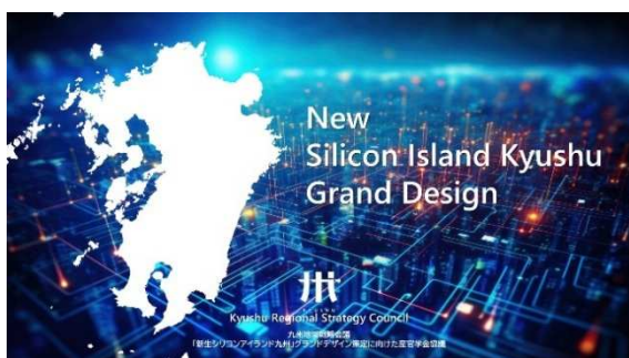
2024.6月 新生シリコンアイランド九州グランドデザイン