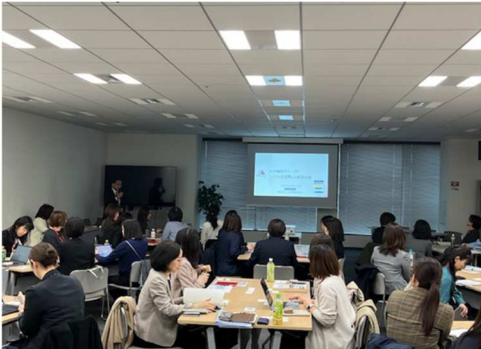
2025.3月「WE-Net九州」第一回定例会