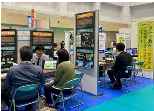
2024.11月 脱炭素マッチングイベント