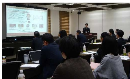
2024.12月 先導的ICT人材育成事業 第1回成果報告会