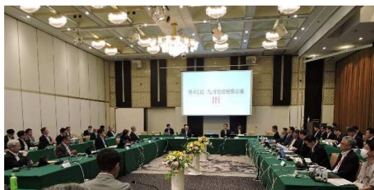
2024.6月 九州地域戦略会議