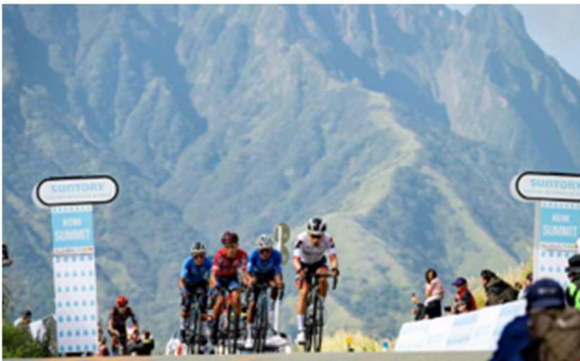
2024.10月 ツール・ド・九州