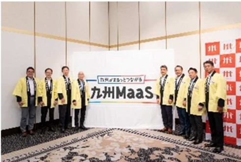
2025.6月九州地域戦略会議 (8月「九州 MaaS」始動を発表)