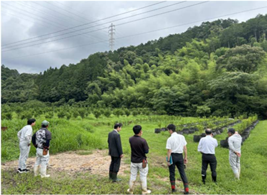
2024.6月 ひむか農園 視察（日向市）