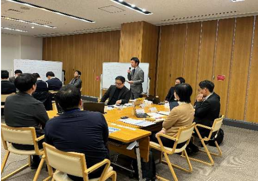
2025.3月 合同勉強会 (九州地域戦略会議 安全・安心 PT)