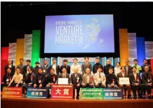
2024.12月 九州・山口ベンチャーマーケット