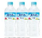
サントリー天然水

南阿蘇外輪山に広がる総面積420haの“天然水の森”をふるさととするサントリー様の「サントリー天然水」を大会公式飲料とすることで、豊かな九州の自然が育んだ水資源の素晴らしさを発信した。